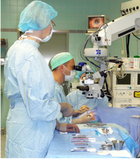
Abb. 1: Links : reale OP-Situation. Der Operateur operiert mit Hilfe des Mikroskops das Auge des Patienten. Die OP-Schwester (im vorderen Bildbereich) reicht ihm die Instrumente. Rechts : die Übertragung der realen OP-Situation in das Trainingssystem für das virtuelle Instrumentieren.