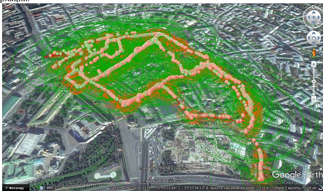
Рисунок 2 – Нанесенные точки доступа на GOOGLE EARTH

Последняя часть работы – обработка полученных данных. Для более полного понимания собранной информации и дальнейшего составления статистики на её основе, удобнее всего обрабатывать данные при помощи соответствующего синтаксического анализатора. С его помощью занесенные в таблицу EXCEL данные должны быть преобразованы в SQL-скрипт для последующего их занесения в базу данных. Из всей полученной информации, посредством запросов, можно получать интересующие в конкретный момент времени данные из всего объема информации.