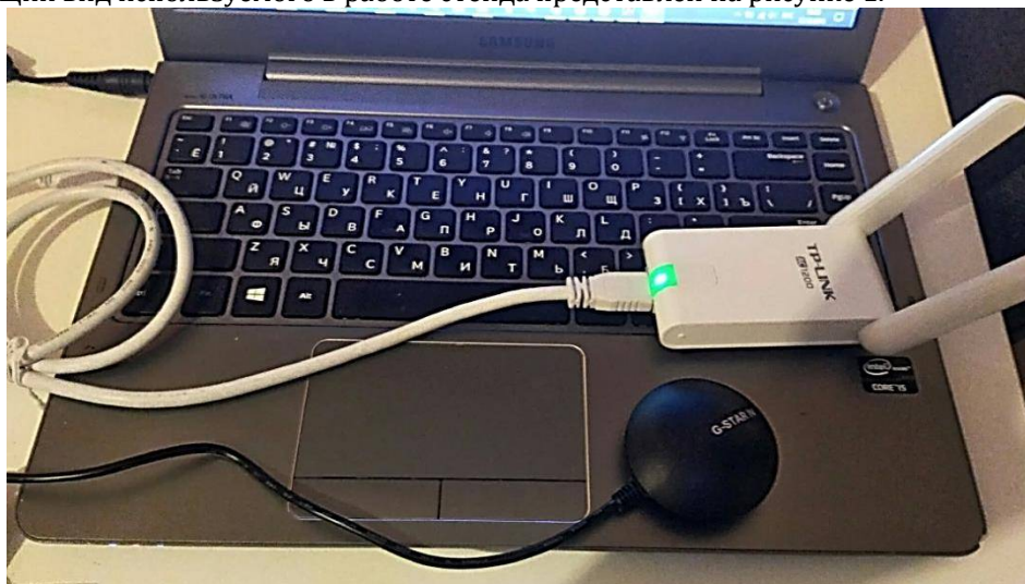
Рисунок 1 – Оборудование для поиска уязвимых Wi-Fi точек

Общий вид используемого в работе стенда представлен на рисунке 1.